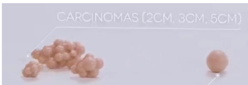
Рисунок 1. Примеры вкладок

Для создания (моделирования) ситуации к каждому из сценариев, следует использовать различные вкладки или разные манекены (Рисунок 1), которые необходимо вложить в соответствующие ячейки симулятора или манекена (рисунок 2).