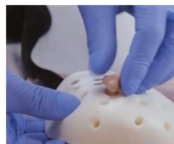
Рисунок 2. Вложение

АК по своему выбору выставляет на симуляторе ситуацию для каждого из четырех сценариев настоящего паспорта в зависимости от возможностей симуляционного оборудования и специальности аккредитуемого. В соответствии с выбранной к каждому сценарию ситуацией заполняются эталон для оценки, медицинская документация для четырех сценариев и предоставляется членам АК для обеспечения объективной оценки действий аккредитуемого по 31-33 пунктам краткой версии чек-листа или по 43-47 пунктам расширенного чек-листа.